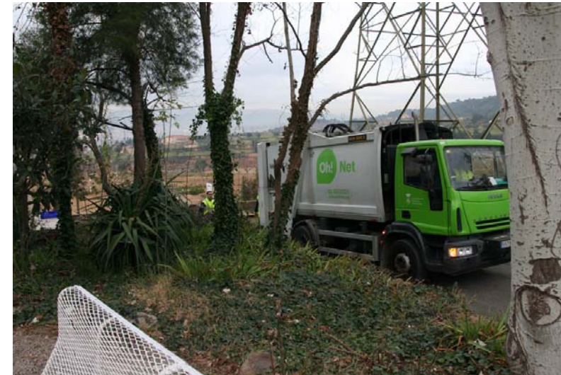
El camió de l'Ajuntament enduent-se les deixalles de paper i cartró de l'escola un dijous al matí.

De l'ecoauditoria se'n desprèn la idea que la gestió dels residus que generem no és prou sostenible. En el cas del paper, la quantitat que consumim és massa elevada: cada membre de l'escola gasta cada any 7,4 kg de fulls de paper blanc i 3 kg de paper higiènic. A més, de tot aquest paper no se'n fa una recollida selectiva adient i només se'n recicla un petit percentatge. Esperem que aquest treball contribueixi a millorar la situació i col·labori a què l'escola esdevingui una institució modèlica en aquest àmbit.