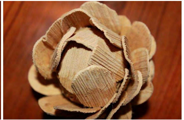
“la flor de fusta”

No vaig decidir quina de les dues imatges estaria millor posar, tot i que penso que es millor la segona imatge (la de la dreta), així que he pensat de ficar les dues. S’observa amb detall com es la fusta i s’enfoca en diferents punts.