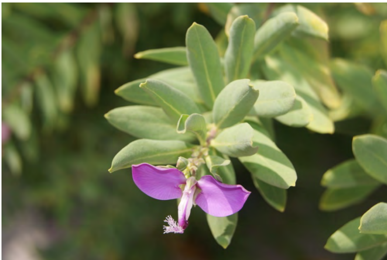
“la flor lila”

La vaig fer a casa d’una amiga que tenia moltes coses de fusta que hem van cridar l’atenció.