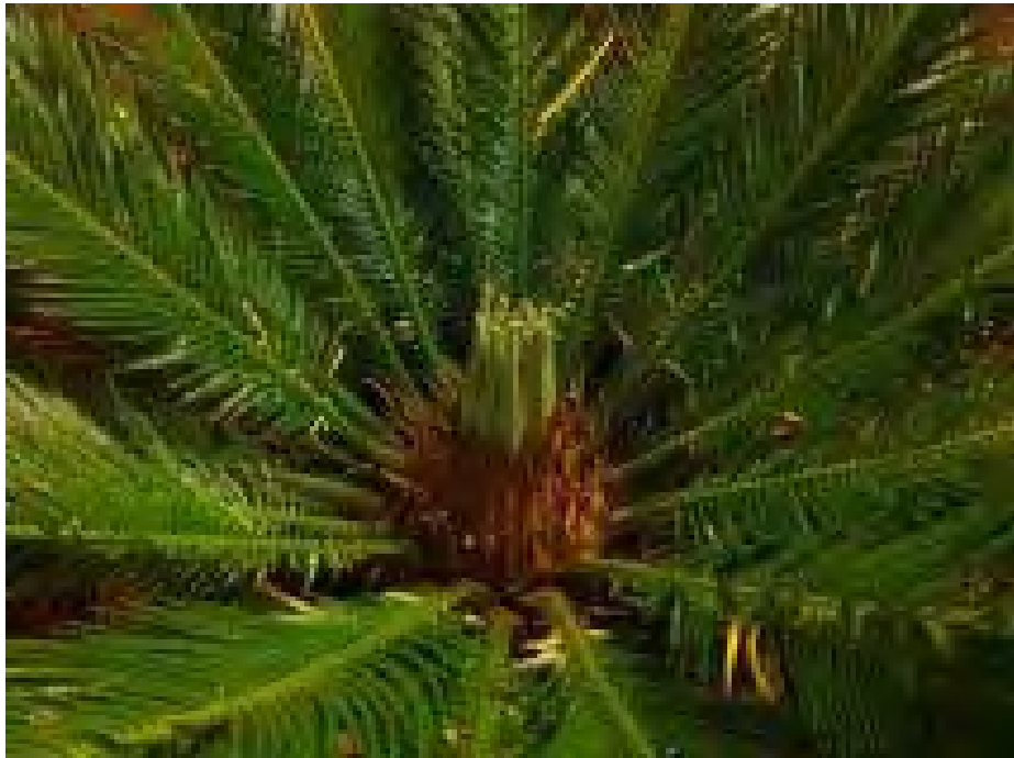
INICI D'UNA NOVA VIDA

Aquesta imatge, és una palmera que tinc a casa meva a dintre d'un dels meus patis. Es una imatge que vaig fer a la palmera, perquè quan vam venir de vacances vam veure que estaven sortint nous fills. Tenia pensat poder seguir el procediment i poder fer una foto cada dia, però vam haver de tornar a marxar de vacances i no ho vam poder veure. Jo he escollit aquest títol, perquè representa que és l'inici de la vida del que van arribar a ser vint-i-sis fills.